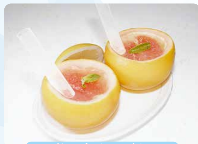
グレープフルーツゼリー