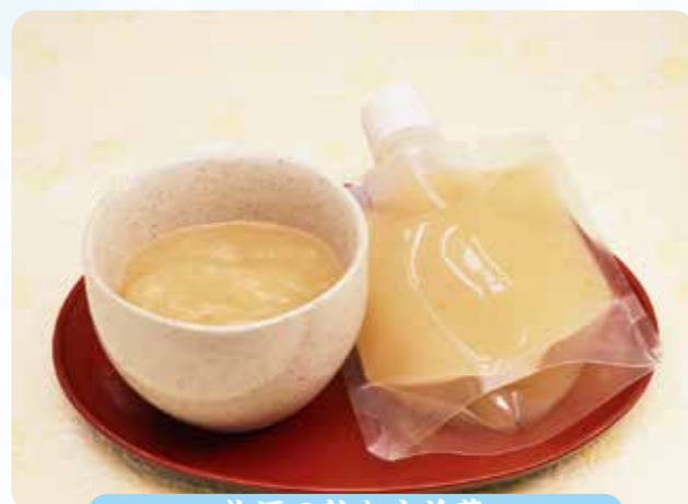
梅酒の飲む水羊羹