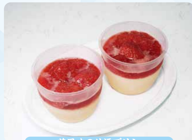
苺風味の甘酒プリン