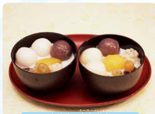
水羊羹の麼麼咋咋