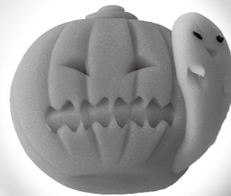
「ジャック・オー・ランタン」